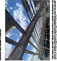
Una buona idea iniziale della struttura consente di realizzare dove si possono realizzare le parti più importanti del progetto, in questo modo si evitano i problemi di cronaca.