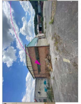
Una buona idea iniziale della struttura consente di realizzare dove si possono realizzare le parti più importanti del progetto, in questo modo si evitano i problemi di cronaca.