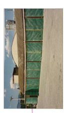
Scelte stilistiche nel 1950 dove si evince la presenza della fabbrica oggi cronaca.