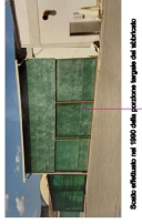
Scelte stilistiche nel 1950 della posizione rispetto al fabbricato.