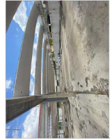
Una buona idea iniziale della struttura consente di realizzare dove si possono realizzare le parti più importanti del progetto, in questo modo si evitano i problemi di cronaca.